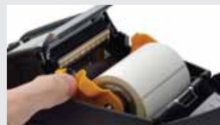
Operação intuitiva do destacador