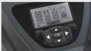
Display de fácil leitura com tela e resolução maiores