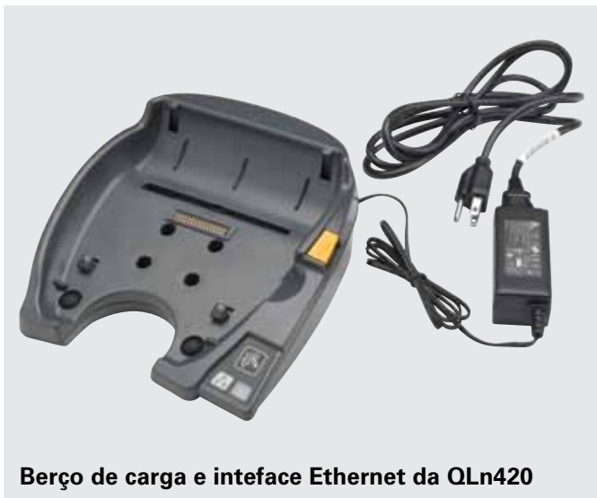
Berço de carga e interface Ethernet da QLn420

A impressora continua totalmente funcional para que você possa imprimir enquanto ela estiver no berço. As luzes LED do berço indicam o status da alimentação DC e da interface Ethernet.